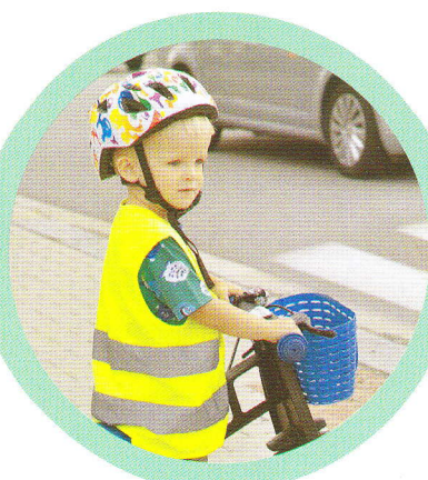
Správné vidění zdravých očí